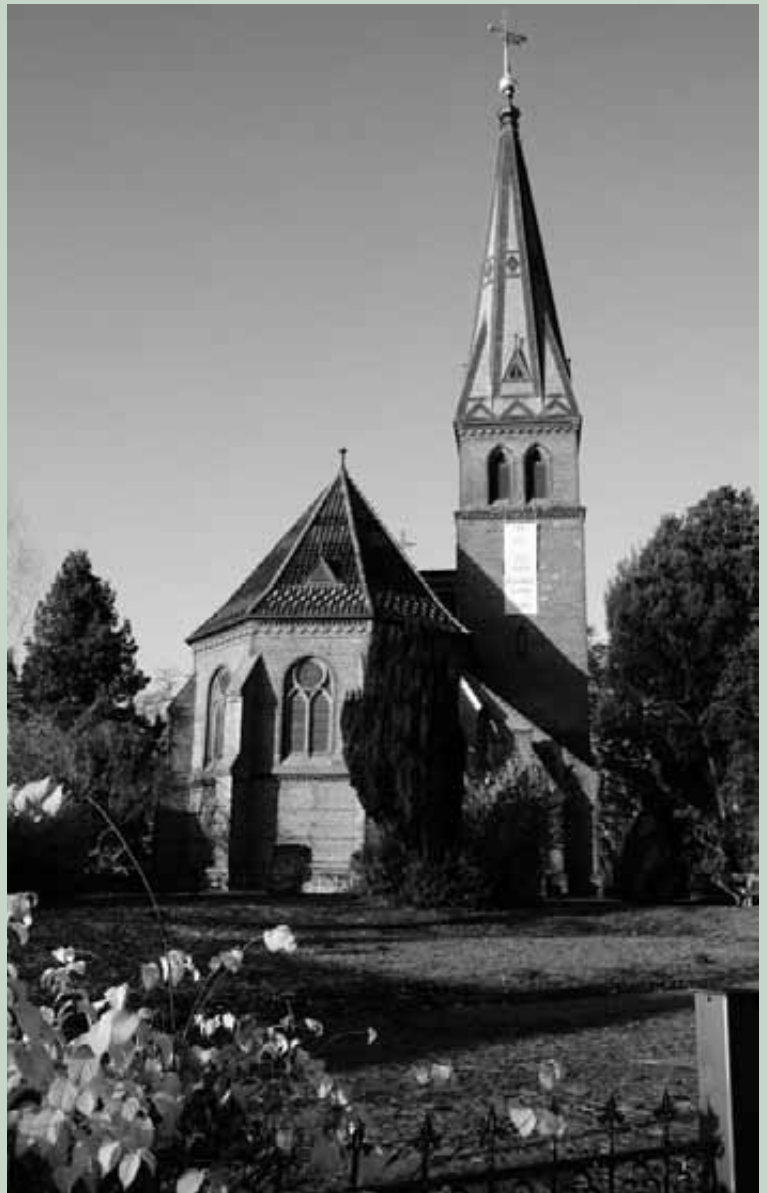
Die Geltower Kirche