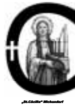
„St. Cecilia“ Michendorf

KATHOLISCHE KIRCHENGEMEINDE ST. CÄCILIA Michendorf Langerwischer Str. 27A. 14552 Michendorf mit den Gottesdienstorten: Beelitz, Karl-Liebnecht-Str. 10 sowie Wilhelmshorst, Ravensbergweg 6