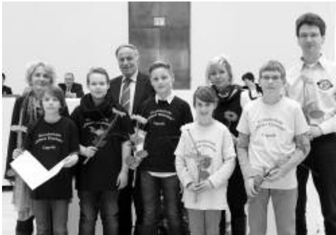
Die Schülerzeitungsredakteure nehmen die Auszeichnung entgegen

Und die Schülerzeitungsredaktion des „Einsteinchens“ war wieder mit dabei! Große Freude herrschte in der Redaktion, als wir die Einladung in den Händen hielten. Und es war dann auch eine ziemlich aufgekratzte Mannschaft, die da am Montag Vormittag im Plenarsaal des Brandenburger Landtages Platz nahm – verständlich, so eine Ver-