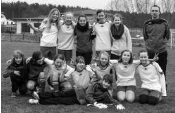
Die D-Juniorinnen der SG Schwielowsee nach ihrem Erfolg im Pokalfinale

Ein sensationeller Doppelschlag gelang den C- und D-Juniorinnen der SG Schwielowsee mit Siegen über ihre Gegnerinnen im Halbfinale des Landespokals.