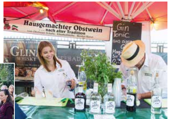
... und Trank war reichlich gesorgt