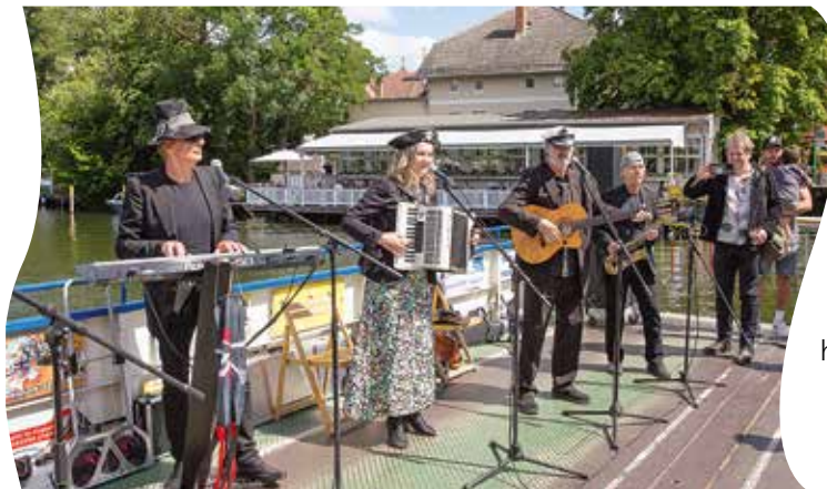
Die Fercher Obstkistenbühne ist mit ihrem musikalischen Programm jedes Jahr fester Bestandteil der Eröffnungsfeierlichkeiten zum Fährfest