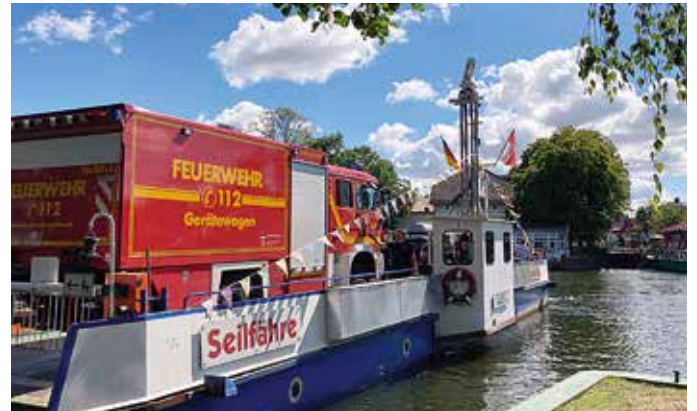
Während die ganz frühen Gäste beim Freiluftkonzert der Männerchöre Caputh und Geltow bereits den ersten Fröhschoppen genießen konnten, schob die Fähre, Namensgeberin des Festes und „Lastesel“ par excellence, noch Schichten – als unverzichtbares und stark frequentiertes Bindeglied der Gemeinde