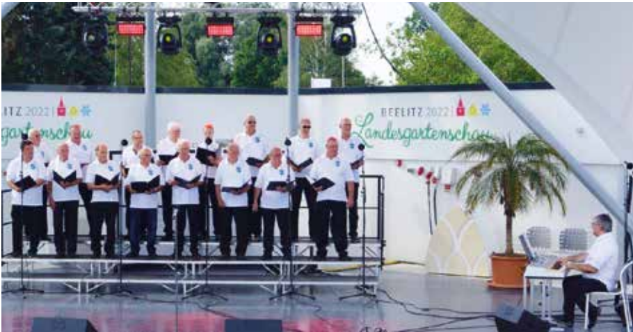
Der Männerchor „Concordia“ Geltow bei seinem Auftritt zur Landesgartenschau

Einer der ältesten Vereine in Schwielowsee lebt wirklich noch, obwohl wir kaum in Erscheinung getreten sind, und zwar der Männerchor „Concordia“ Geltow. Wegen der Coronaregeln konnte nur sehr eingeschränkt geprobt werden und die geplanten Auftritte mussten leider ausfallen. Nun geht es aber so langsam wieder los und wir freuen uns schon darauf.