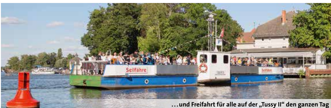
... und Freifahrt für alle auf der „Tussy II“ den ganzen Tag