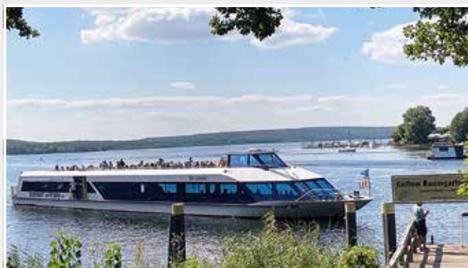
Die MS „Belvedere“ legt bei Baumgartenbrück an

Wir werden wieder mit dem bequemsten und schönsten Schiff der Weißen Flotte, der MS „Belvedere“, unterwegs sein, eine Insel- und Schlösserrundfahrt genießen und noch Spielraum für eine Überraschungstrecke haben.