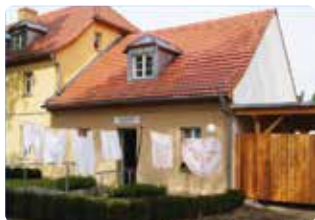
Das Heimathaus Geltow