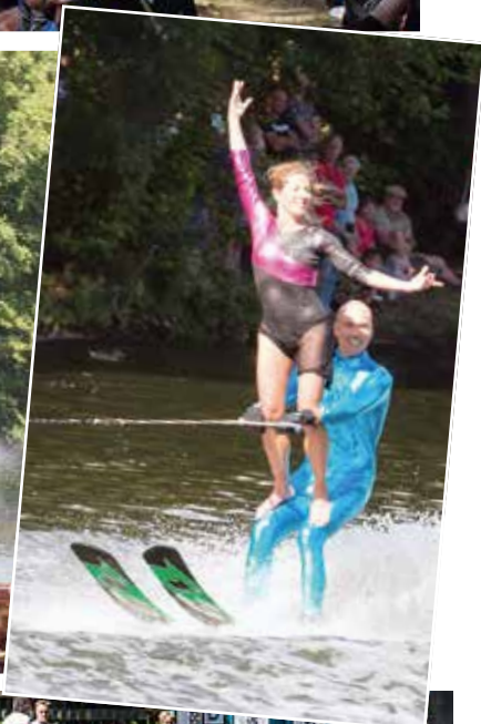
Die Sportler zogen alle Register ihres Könnens: Spektakuläre Acts auf dem Wakeboard hinter 400 PS, tollkühne Sprünge über die Schanze, artistisches Wasserskiballett...