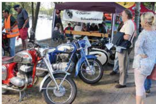
Die „Schätzchen“ der IG Oldtimer zogen die Blicke des Publikums auf sich