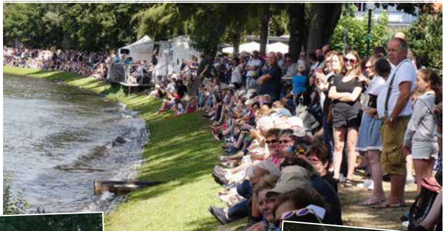
Tausende Schaulustige verfolgten am Gemünde die Show