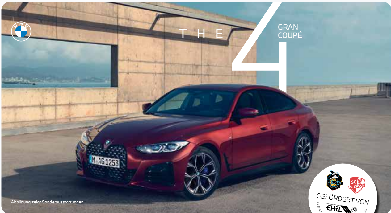
Abbildung zeigt Sonderausstattungen.