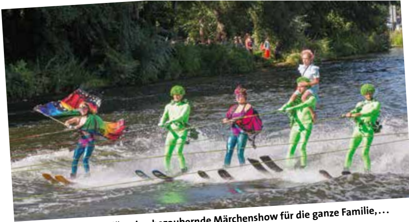
„Alice im Wunderland“ – eine bezaubernde Märchenshow für die ganze Familie,...