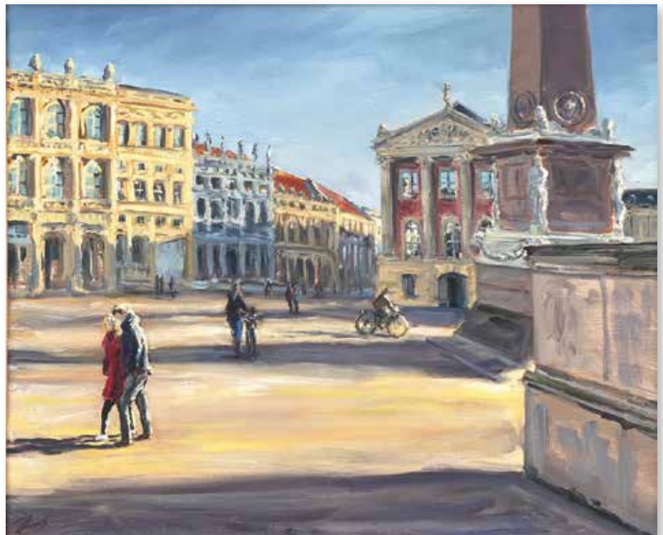
„Am späten Nachmittag“, Thomas Freundner, Öl auf Leinwand, 50 x 60 cm

Eine alte Bekannte von Freunden der Schlossgalerie, Monika Bienert, spricht am Samstag, dem 24. September, um