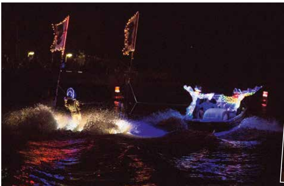
Gegen 22.15 Uhr dann am Fähranleger gespannte Ruhe vor dem letzten Teil der Show, dem illuminierten Nachtskilaf und dem grandiosen Höhenfeuerwerk über der Havel als krönendes Finale