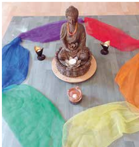
Kreismitte auf der Tanzreise

men Zimmern und Gemeinschaftsräumen, veganem Essen und wunderbarer Stille. Insgesamt 18 Frauen aus verschiedenen Tanzgruppen waren dabei. Wir begrüßten den Tag mit einem Morgenritual, das uns sogar die Mücken ignorieren ließ, kümmerten uns tänzerisch bewegt um unsere Kopf-, Herz- und Bauchquellen, ließen die Regenbogenfarben leuchten, hatten viel zu lachen und lernten uns auf eine schöne Weise kennen, die Lust aufs nächste Mal machte.