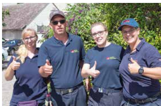
Für die Sicherheit zuständig: die Männer und Frauen von Feuerwehr und Security – ohne sie wäre kein Fährfest möglich