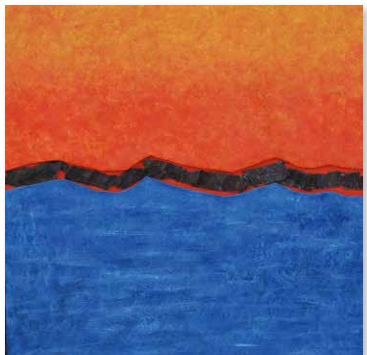
„Aufbruch“, 2021 Pappe, Papier, Sand, Acryl, Metall