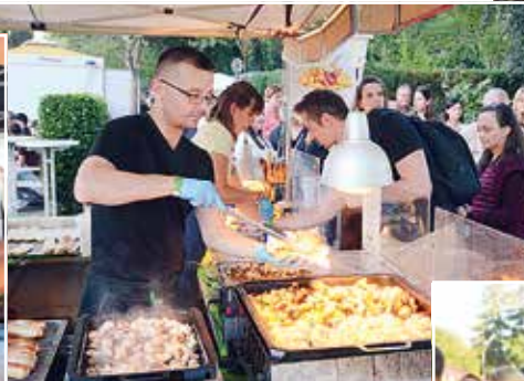
... oder herzhaft Gegrilltes: Für Speis...