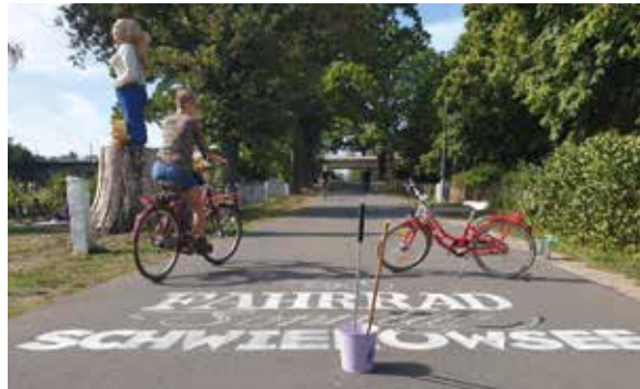
Zum Picknickradeln rund um den Schwielowsee lockt der 23. Fahrradsonntag

Caputher Schützengilde in Flottstelle halten und ein kühles Getränk genießen, während sich die Kinder auf der Hüpfburg austoben. Wer noch mehr Abkühlung möchte, ist am Strandbad Ferch richtig, das an diesem Tag von 10 bis 21 Uhr für einen Sprung in den See geöffnet ist.