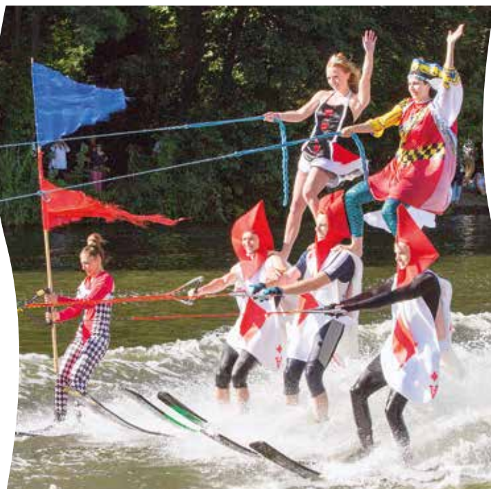
Der Wasserskiclub Caputh Preussen e.V. – Wasserskiakrobatik der Extraklasse

Dann wurde es laut auf dem Gewässer: Die Boote des Wasserskiclubs Caputh donnerten mit ihren 400 PS über die Havel und rissen die Sportler zu Höchstleistungen mit.