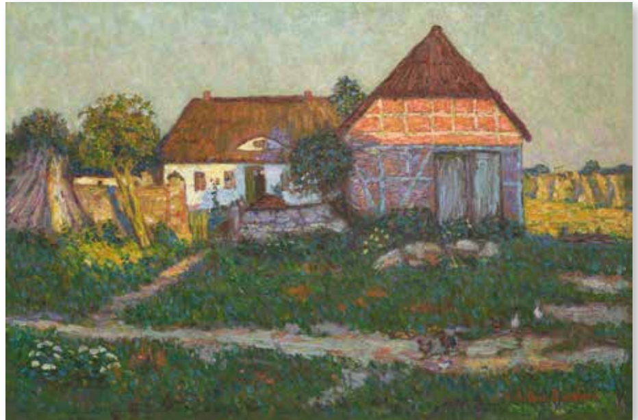
„Bauerngehöft am Kornfeld“, Arthur Borghard (1880–1958), um 1919, Öl auf Leinwand, 80 x 120 cm