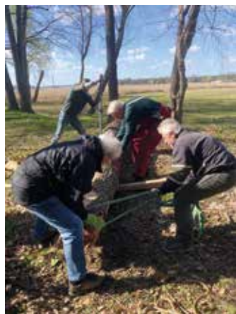
Räumaktion auf dem Alten Fährweg am 7. April

die Freude währte nicht lange. Äste und Baumabschnitte sowie ganze Bäume, die quer über dem Weg lagen, erschwerten die Nutzung oder machten sie ganz unmöglich.