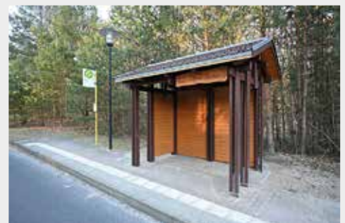
Da steht es nun, das letzte neue, barrierefreie Wartehäuschen in Ferch