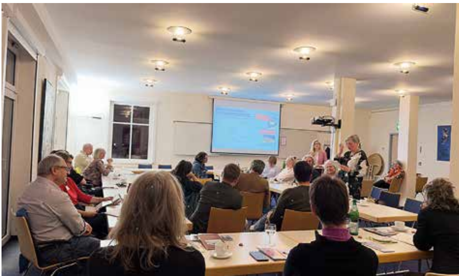
Auch Zahlen und Fakten wurden präsentiert bei der Tourismuswerkstatt im gut besuchten Bürgersaal des Rathauses in Ferch