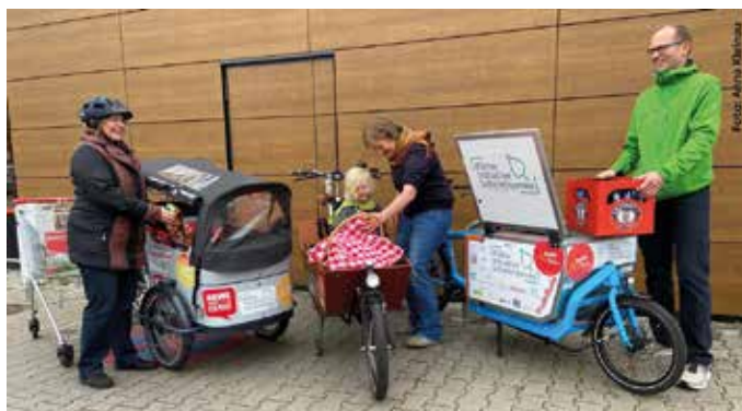
Die drei Lastenräder für Geltow, Caputh und Ferch

de schon fast alles, was der Alltag bereithält: Lebensmitteleinkäufe, Gartenpflanzen und Getränkekästen ebenso wie Kinder und Badesachen für den Ausflug an den See. Auch Campingausrüstung mit Zelt, Schlafsack und Isomatten fand problemlos Platz. Selbst sperrige Dinge wie Sonnenschirme, Zementsäcke oder ein Baum aus der Baumschule wurden transportiert. Bei