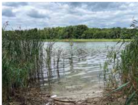
Schilfröhricht am Großen Lienuwitzsee – Lebensraum und Uferschutz, sofern nicht zertreten

Es ist zu hoffen, dass sich am Uferstreifen mehr Erlen ansiedeln und ihn stabilisieren. Noch besseren Schutz bieten Schilfgürtel.