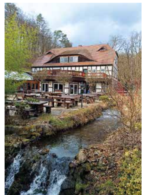
Die Boltenmühle am Binenbach in der Ruppiner Schweiz war das Ziel der Reise