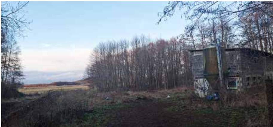
Düster-melancholisch liegt das alte Gehöft in der Geltower Feldflur

Doch ebenso klar ist: Nicht jeder Eingriff in die Landschaft lässt sich allein mit dem Hinweis auf Klimaschutz rechtfertigen.