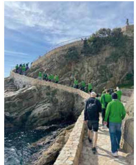
Gemeinsame Erlebnisse abseits der Stadien – Wanderungen an der Costa Brava

Den Abschluss bildete ein gemeinsamer Tag in Barcelona. Die imposante Sagrada Família, die engen Gassen des gotischen Viertels und der Besuch am legendären