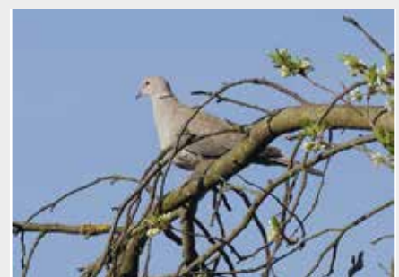
Die früher häufige Türkentaube ist wegen moderner Erntetechniken und steriler Gärten seltener geworden