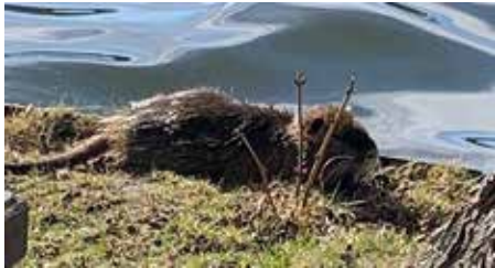
Nutria am Nordufer des Caputher Sees, Winter 2025/26

Am Ufer des Caputher Sees sind sie inzwischen von vielen gesichtet worden: Nutrias.