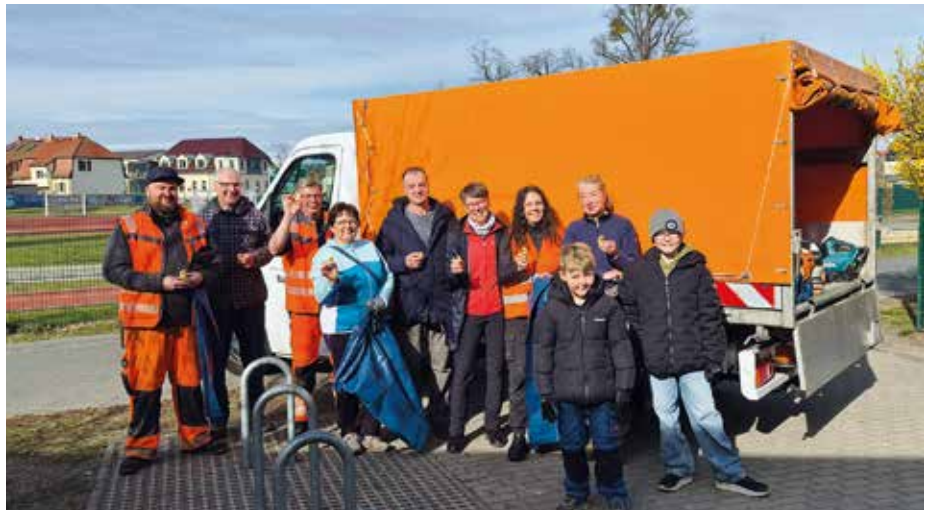
Einen Schokoladenosterhasen gab es gleich am Start als kleine Motivation für die fleißige Truppe

Nachdem große Müllbeutel und Arbeitshandschuhe ausgegeben worden waren, teilte man sich auf, um rund um den Krähenberg, den Caputher See und das Gemeinde Müll einzusammeln. Unterwegs