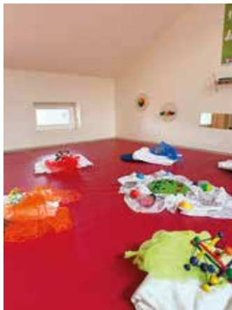
Krabbel- und Spielecke für die Babygruppe

Anmeldung vor erster Teilnahme erwünscht. Gemeinsam singen, spielerisch die Welt entdecken und uns bei Kaffee/ Tee austauschen. Kosten: 1 Euro Spende