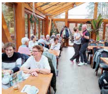
Kaffeetrinken in gemütlicher Runde – sogar zum Tanz wurde aufgespielt