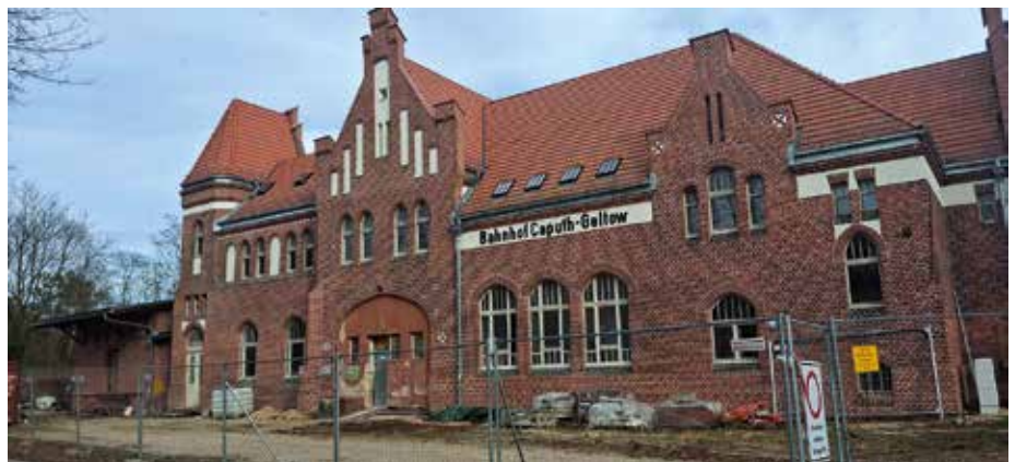
Noch ruht still der See auf der Baustelle des frisch restaurierten Bahnhofgebäudes Caputh-Geltow an der Alten Ladestraße

Egal, wie die Entscheidung ausfällt: Dieses Tor zu unserer Gemeinde muss wieder dem Charakter unseres Erholungsortes entsprechen. ■ Marina Katzer