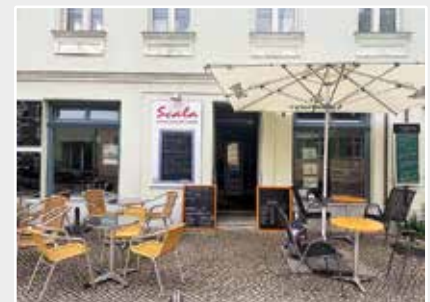
Das Scala-Künstlercafé auf der Insel in Werder

... auf der Altstadtinsel Werder das Scala Künstler-Café & Bar des Scala Kulturpalastes geöffnet hat? Hausgebackene Kuchen, köstlicher Kaffee, eine große Auswahl an Getränken und Limonaden sind im Angebot, von 10 bis 14 Uhr wird ein Frühstück angeboten, dazu ganztägig Omeletts, Flammkuchen und eine umfangreiche Imbisskarte. Die ersten Obstweine des Jahrgangs 2026 vom Weingut Gaube aus Werder sind auch bereits eingetroffen.