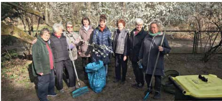
Die fleißigen Frauen der Sportgruppe bereit zum Arbeitseinsatz. Offensichtlich standen die Männer in Wildpark-West derweil am häuslichen Herd