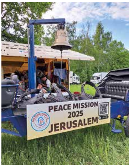
Im vergangenen Jahr machte der Friedenstreck im Geltower Brückenpark erste Station

Vor genau einem Jahr machte der Friedenstreck aus Brück zu Beginn seiner langen Reise nach Jerusalem seine erste Station bei uns im Geltower Brückenpark. Mit ihren Pferdegespannen und einem eingeschworenen Team aus Menschen, die Pferde lieben und für den Frieden brennen, wollten sie 80 Jahre nach dem Ende des Zweiten Weltkriegs eine Friedensglocke nach Israel als Zeichen des Friedens und der Bitte um Versöhnung bringen. 14 Länder und sage und schreibe 3600 km trennten den Friedenstreck von seinem Ziel. Die Anteilnahme der Geltower war groß und herzlich. So ein Vorhaben macht schon ehrfürchtig und gleichzeitig war schnell der Gedanke da: „Was auf dem Weg alles passieren kann...“ oder, wenn einen die Abenteuerlust kitzelt: „Was die alles Spannendes erleben werden...“ In einem Jahr, wo gute Nachrichten selten geworden sind, tragen solche Vorhaben und Begegnungen dazu bei, die Hoffnung nicht zu verlieren, dass es auch einmal wieder eine Zeit geben wird, wo friedliche