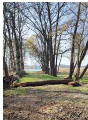
Situation auf dem Alten Fährweg wenige Tage nach dem 7. April

Nun ist der Kreis wieder gefordert, Recht und Gesetz durchzusetzen. Das Naturschutzgesetz gibt jedem Bürger die Befugnis, private Wege und Pfade zu betreten und sogar mit Fahrrädern oder Krankenfahrrädern zu befahren. Sie behindern nicht nur die Nutzung des Weges, sondern bedeuten auch eine erhebliche Verletzungsgefahr. In einem seiner Beschlüsse in dieser Sache hat das Oberverwaltungsgericht Schilder mit der Aufschrift „Privateigentum“ wegen der psychologischen Sperrwirkung als naturschutzrechtlichen Eingriff eingeordnet. Wenn das Gericht schon psychologisch wirkende Sperren für unzulässig hält, muss dies doch erst recht für tatsächlich wirkende Sperren gelten. Rechtlich muss der Landkreis