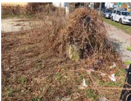
Der völlig verwahrloste Platz in Geltows Mitte