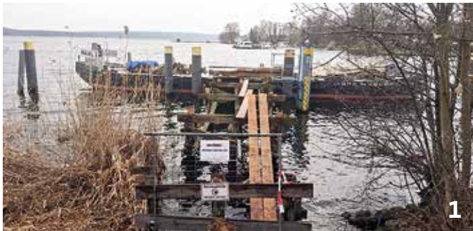
Die Dampferanlegestelle Baumgartenbrück ist in die Jahre gekommen. Deshalb war eine gründliche Überholung erforderlich

Einwohner von Geltow und Weg zu den beliebten Ausflugsbooten der „Havelschwärmer“ sicher nutzen – etwa für den ne“. ■ Marina Katzer