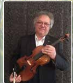
Alexander Babenko