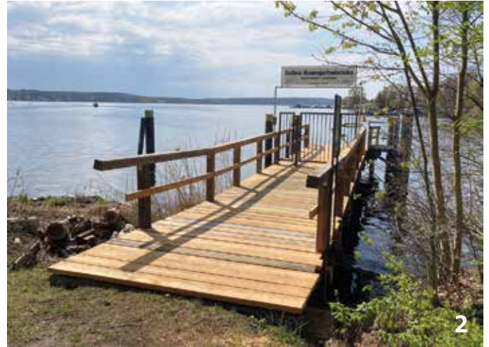
Pünktlich zum Baumbülfest in Werder ist die neue Steganlage fertig. Die Stolperfallen sind beseitigt und die Anlegestelle wurde runderneuert. Jetzt fehlt nur noch der Zugang von der Straße