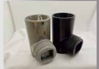
Gebrochene Sonnenschirm-Schelle alt -> neu