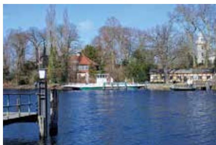
Start und Ziel der Wanderung ist der Fähranleger zur Pfaueninsel

Treffpunkt: Waldparkplatz am Nikolskoer Weg oberhalb des Fähranlegers Caputher Heimatverein e.V., Tel. 033209-70260, www.heimatvereincaputh.de