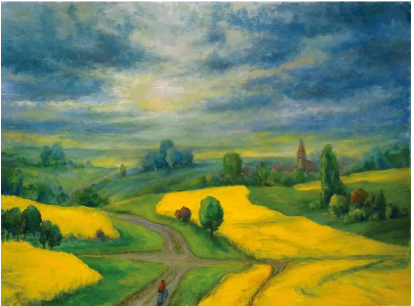
„Bewegtes Land“ | Thomas Kahlau | Acryl auf Leinen | 80 × 60 cm