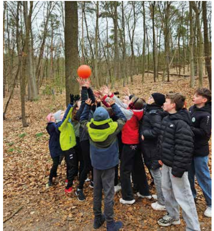
Klasse 5b beim Fund des großen runden Ostereis

Zurück im Schulhaus, wartete bereits die nächste Überraschung in den Klassenzimmern. Der Schulförderverein hatte im Vorfeld die Wünsche der Lehrer gesammelt und neue Spiele für jede Schulklasse angeschafft, darunter