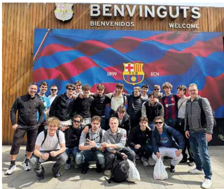
Die erfolgreiche U19 des CSV vor der Spielstätte des FC Barcelona, dem Camp Nou