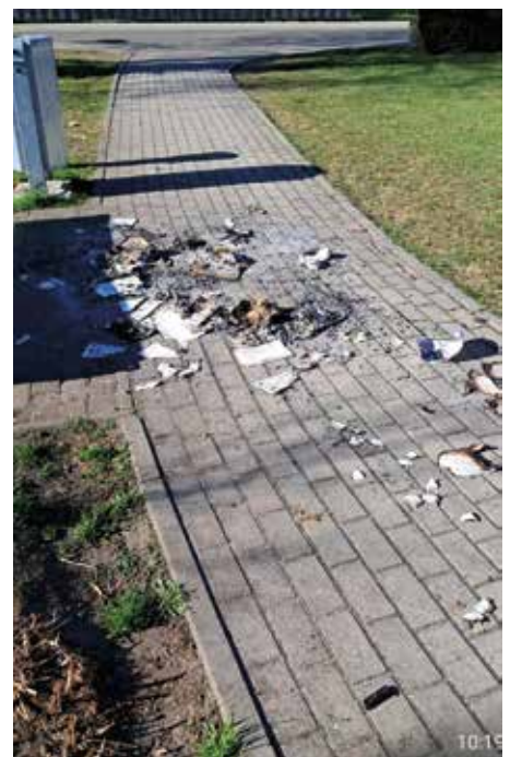
Auf Kosten der Allgemeinheit wurde hier Schaden gestiftet. Aus Langeweile, Frust, Protest?