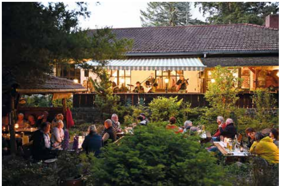
Wie in alten Zeiten – ein herrlicher Sommerabend in der Wildschweinbäckerei Ferch

Der Baulärm verhallte, als gegen 16 Uhr die ersten Klänge des Soundchecks der Blue Babel Hills in der Wildschweinbäckerei zu hören waren. Am 5. Juni fand nach längerer Pause wieder eine Veranstaltung in Sperlingslust statt. Es wurde ein herrlicher Sommerabend. Vor dem zweistündigen Konzert gab es ein 3-Gänge-Menü mit Wildschwein aus dem Steinbackofen. Von den Gästen bekamen wir durchweg positive Rückmeldungen. Das beste Lob für mich an diesem Abend kam von einer Frau, die mit ihrem Mann viele Jahre in der Wildschweinbäckerei Stammkundin war. Sie sagte: „Das schmeckt ja wie früher.“ Alte Geschichten von den Anfängen der Wildschweinbäckerei wurden erzählt. Viele Gäste fragten nach einer Wiederholung. Heute kann ich sagen: Das werden wir gerne tun. ■ Katrin Paulus