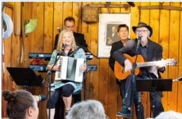
Eine kulturelle Instanz im Land Brandenburg: die Fercher Obstkistenbühne – hier beim Freiluftkonzert zum Fahrradsamstag 2023

Zuschauer Humor und Romantik in eigenen und Fontanes Kreationen am Abend : „Landmusik vom Drehort Schwielowsee“ und „Mit Fontane um den Schwielowsee – von Caputh (Brandenburg) nach Caputh (Schottland)“ und zum Familiennachmittag : „Mit Fontane beim Vogelscheuchenball am Schwielow“ – auch freiwillig in Kostümen. Vom 2. bis 15. August dürfen die Gäste wieder mit den Holzpantinen klappern und mitsingen – www.fercherobstkistenbuehne.de . ■ Ingrid Protze / HB