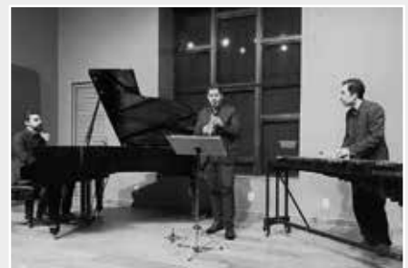
Das „Brazil Ragtime Trio“, das in die mondäne Zeit des frühen 20. Jahrhunderts entführt