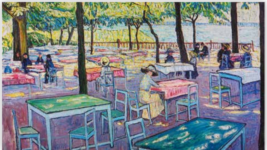
Die Älteren kennen ihn noch: Den Kaffee- und Biergarten in Baumgartenbrück...

wie man lesen konnte, zeitweise den Spitznamen „van Goghhusen“ einbrachte. Er erhielt zahlreiche Auszeichnungen, so auch 1910 den Kunstpreis der Stadt Berlin. 1913 konnte er ein Stipendium für einen sechsmonatigen Aufenthalt in Florenz bekommen, Gelegenheit, die italienischen Meister vor Ort kennenzulernen. Zwischen 1914 und 1918 finden wir