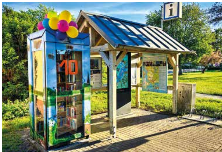
Eine Insel der Unterhaltung und des Wissens – die Geltower Bücherzelle am Wimmerplatz