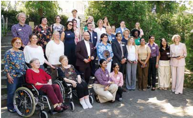
Die fünf Altenpflegerinnen inmitten der Organisatoren und Gäste

Deshalb entwickelte die Deutsche Fachkräfteagentur für Gesundheits- und Pflegeberufe (DeFa) 2024 ein Konzept, das vorsieht, bereits in ihren Heimatländern qualifizierte Pflegekräfte in das deutsche Pflegesystem zu übernehmen. Damit verbunden ist neben der praktischen Tätigkeit ihre weitere Qualifizierung.