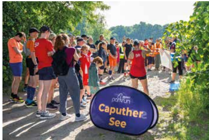
Begrüßung und Einweisung zum ersten Caputher parkrun

Computer und Handy nahe zu bringen.“ Und so folgten am 30. Mai 75 „Frühaufsteher“ bei idealem Wetter der Einladung zum ersten Caputher parkrun.