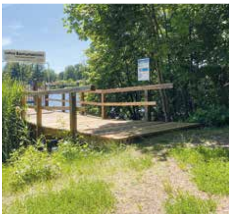
Noch ist der Zugang zum neuen Steg für Senioren unwegsam bis riskant

In unserer Aprilausgabe berichteten wir über die Sanierung des Dampferanlegestegs Baumgartenbrücke, nachdem wir auf fehlende Planken und Schadstellen hingewiesen hatten (HB 10/2025, Seite 12). Nun wurde der Steg zwar erneuert, aber es fehlt die Anbindung bis zum Fußweg (siehe Foto). Für Rollator- und Rollstuhlfahrer eine Gefahrenstelle, ebenso für Gehbehinderte. Bei einem Unfall ergäben sich versicherungsrechtliche Fragen. Vielleicht gibt es in unserer Gemeinde eine Firma, die sich dieses Problems annimmt? Die Senioren würde es freuen. ■ HB