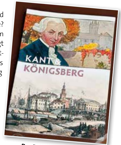
Das Begleitheft zur Ausstellung

all „seinen Senf dazugab“ und dies im wortwörtlichen Sinne? Die Ausstellung wird bis zum 9. August in Caputh gezeigt in Kooperation mit dem Deutschen Kulturforum östliches Europa sowie in Verbindung mit dem Ostpreußischen Landesmuseum Lüneburg und dem Bundesinstitut für Kultur und Geschichte des östlichen Europa Oldenburg. Der Eintritt ist frei. Wir freuen uns über Ihren Besuch! ■ Petra Reichelt, Schlossleiterin