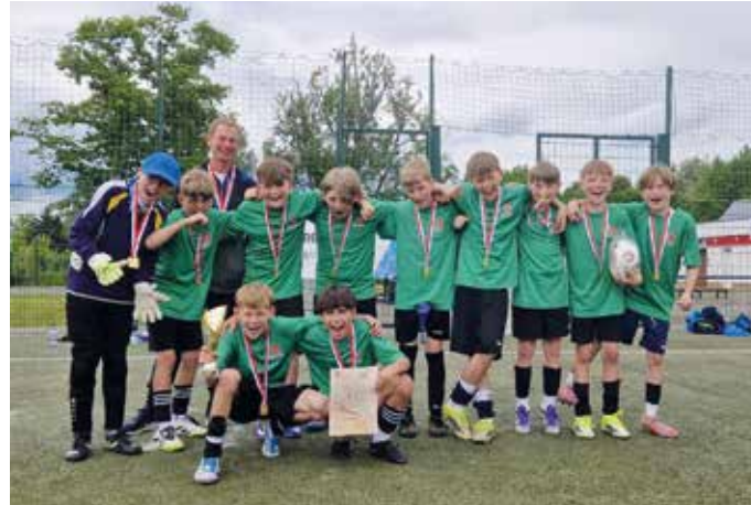
Die erfolgreichen Fußballer der Albert-Einstein-Grundschule Caputh

war dabei die außergewöhnliche Organisation rund um das Landesfinale: Ein Großteil der Mannschaft befand sich zum Zeitpunkt des Turniers auf