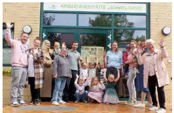
Freude herrschte bei Klein und Groß an diesem außergewöhnlichen Tag