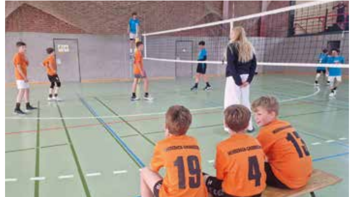
Die Sieger in ihren orangefarbenen Trikots