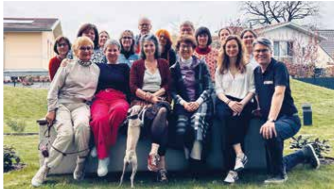
Die Teilnehmer an der Kulturwerkstatt

Wir erarbeiten gemeinsam, wie wir als Gruppe den Verein für die Zukunft aufstellen können und wie wir uns dabei so organisieren, dass die persönlichen Ideen und Talente jedes Einzelnen wirksam eingebracht werden. Aber auch, wie wir die Finanzierung des Vereins zukünftig parallel zu klassischen Fördermitteln erweitern und ausrichten können. Mit dabei sind Vorstandsmitglieder, langjährig Engagierte, neue Vereinsmitglieder und Menschen, die sich künftig stärker kreativ einbringen möchten. Wir sammeln Erfahrungen und lernen gemeinsam. Ein festes Modell gibt es dabei eben nicht. Unsere Vision realisiert sich Schritt für Schritt auf dem Weg.