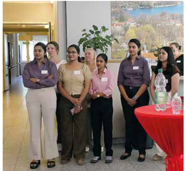
Herzlich begrüßt in der Seniorenpflege: Fachkräfte aus Indien

Die in Schwielowsee mit großer Freude empfangenen fünf jungen Frauen aus Indien besitzen also bereits die fachlichen Voraussetzungen, sind freundlich und zugewandt und sprechen alle deutsch,