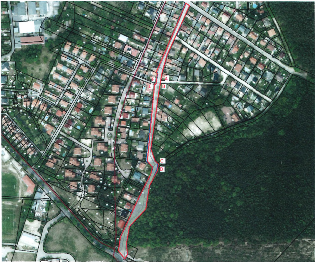
Luftbild, Lage der Straße in rot gekennzeichnet