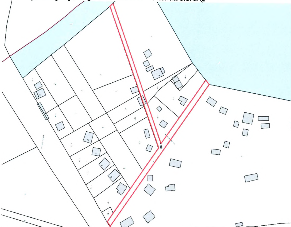
Flurkarte Auszug aus ARCHIKART, Lage der Straße Rot gekennzeichnet