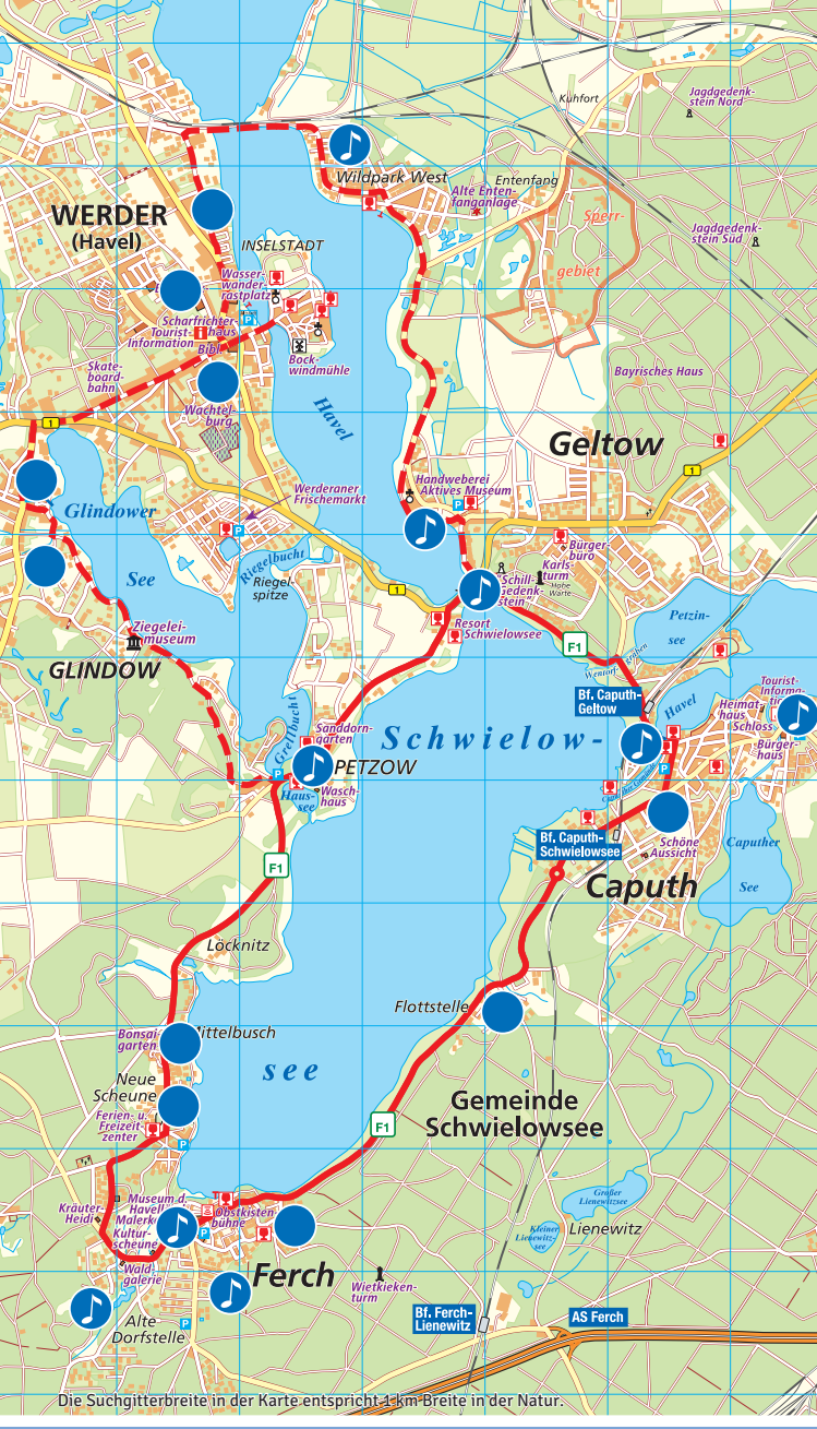
Die Suchgitterbreite in der Karte entspricht 1 km-Breite in der Natur.

IMPRESSUM Herausgeber Kultur- und Tourismusamt · Gemeinde Schwielowsee Potsdamer Platz 9 · 14548 Schwielowsee OT Ferch · www.schwielowsee.de Karte KARTOX Menzel Gestaltung www.fischundblume.de Änderungen vorbehalten! Die Nutzungsrechte liegen beim Herausgeber.